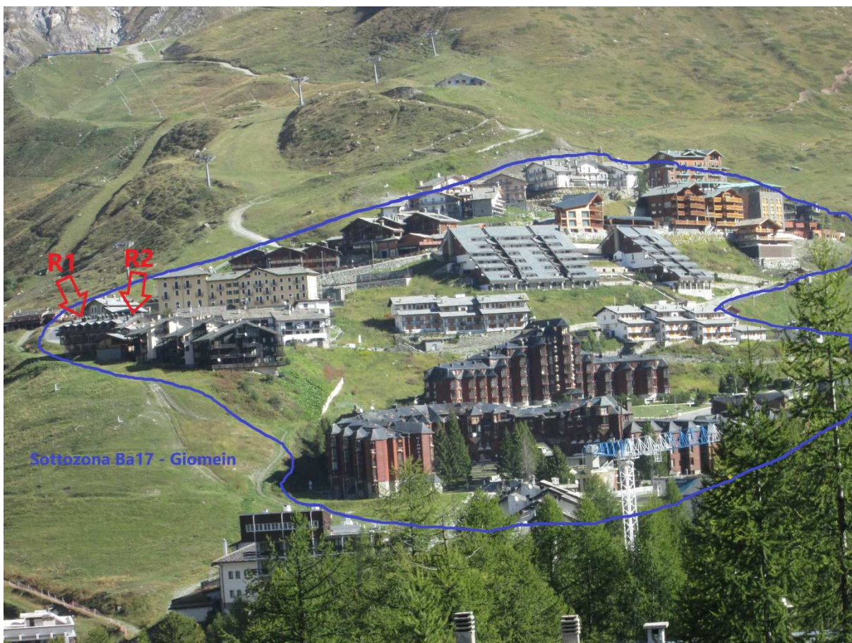
Foto d'insieme da sud dell'agglomerato edilizio del Giomein definito come sottazona Ba17-Giomein nel vigente PRG. Individuazione della parte di sottazona nella quale sono previste le aree da destinare a nuova costruzione di fabbricati per destinazione a residenza principale di cui alla richieste R1 e R2.