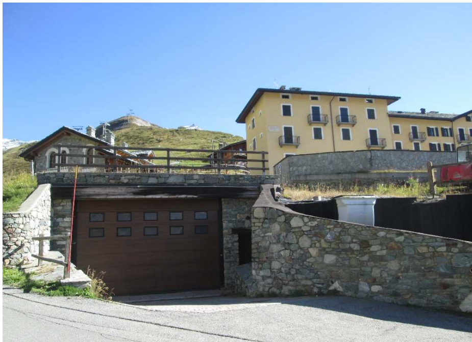
R1 – foto da Sud-ovest del mappale n. 986 Fg. 7, accesso autorimessa interrata “per il ricovero dei mezzi da neve che conducono all’attività (bar ristorante lungo le piste) e deposito materiali per l’attività stessa” Sulla destra R2 – foto parziale del mappale confinante n. 745 Fg. 7