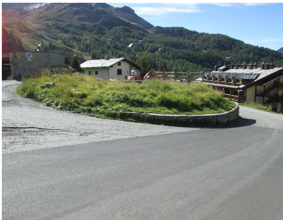
R1 – foto da Nord del mappale n. 986 Fig. 7, area incolta con sottostante autorimessa interrata