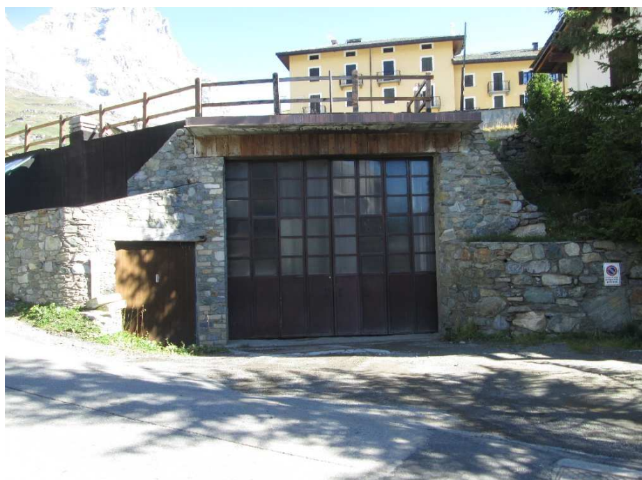
R2 – foto da Sud-ovest del mappale n. 745 Fg. 7, accesso autorimessa interrata “per il ricovero dei mezzi dell’attività di impresa edile”